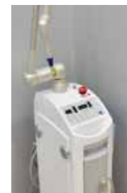
炭酸ガスレーザー