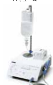
ピエゾン マスターサージェリー (超音波振動外科手術器)