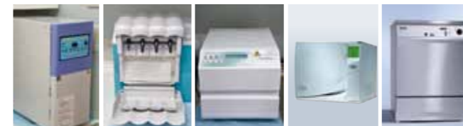
ホルホープ (ガス滅菌器) クアトロケア (自動注油洗浄器) スティティム (高圧蒸気滅菌器) Lisa (高圧蒸気滅菌器) ミーレジェットウォッシャー (洗浄・消毒器)

使用器材の衛生管理のため、洗浄・消毒に関する国際規格(ISO15883)に基づいた高度な洗浄・消毒や、高い安全性を追求した滅菌システムを採用しています。