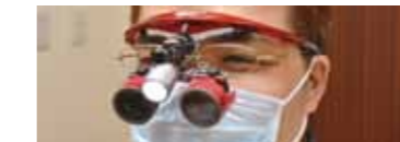
LED 照明付歯科用双眼ルーベ *全スタッフが所持しています。

※歯が欠けたり失われたりした場合に、かぶせ物、差し歯、ブリッジ、入れ歯(義歯)、インプラントなどの人工物で補い、機能・審美を回復することを専門とし、学会で認められた歯科医師です。 社団法人日本補綴歯科学会 http://www.hotetsu.com/p1.html