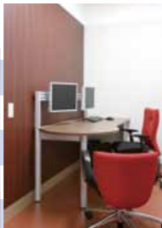
カウンセリングルーム