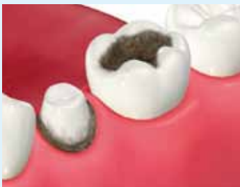
【図2】 銀歯の中の虫歯